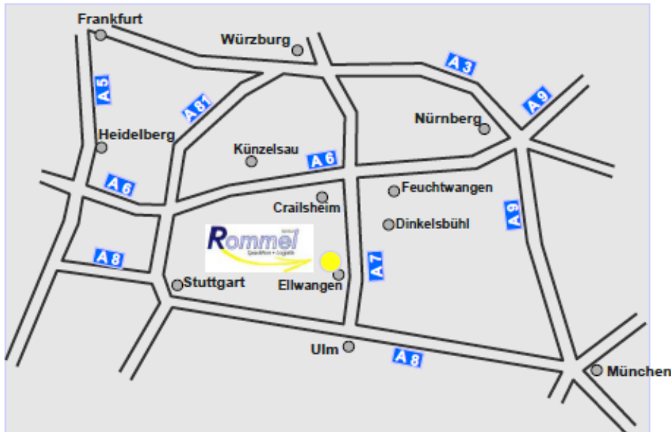
Übersichtsplan Lage der Büro- und Verwaltungsfläche

Autobahn A7: 800 m Ulm: 75 km Nürnberg: 110 km Würzburg: 125 km Stuttgart: 150 km